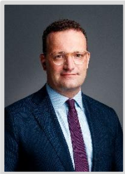
Bundesminister für Gesundheit, Jens Spahn